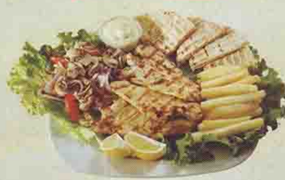
ΦΙΛΕΤΟ ΚΟΤΟΠΟΥΛΟΥ ΣΧΑΡΑΣ ΜΕ ΜΑΝΙΤΑΡΙΑ