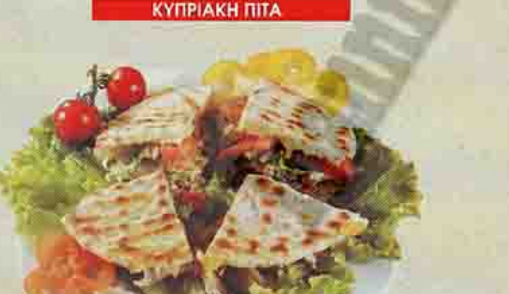
ΠΙΤΑ ΤΟΠ ΜΕ ΜΕΙΓΜΑ ΤΥΡΙΩΝ