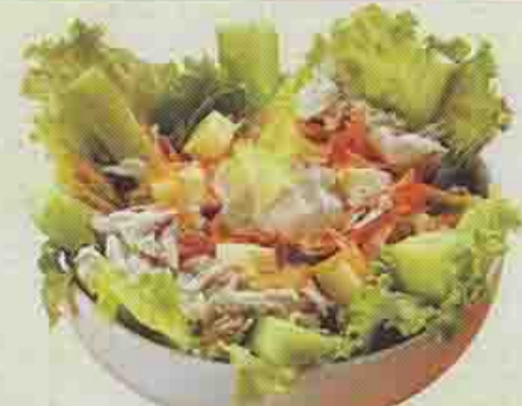
ΣΑΛΑΤΑ: SPECIAL POSTO ΓΩΝΙΑ