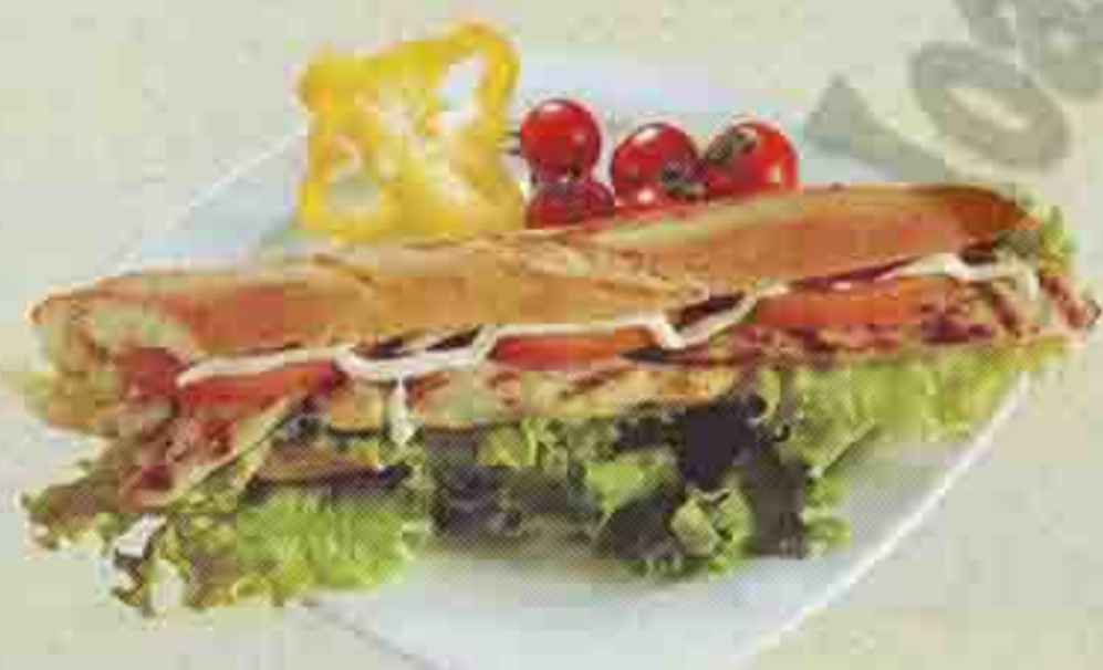
ΜΠΑΚΕΤΑ ΜΕ ΓΕΜΙΣΗ ΦΙΛΕΤΑΚΙΑ ΚΟΤΟΠΟΥΛΟΥ