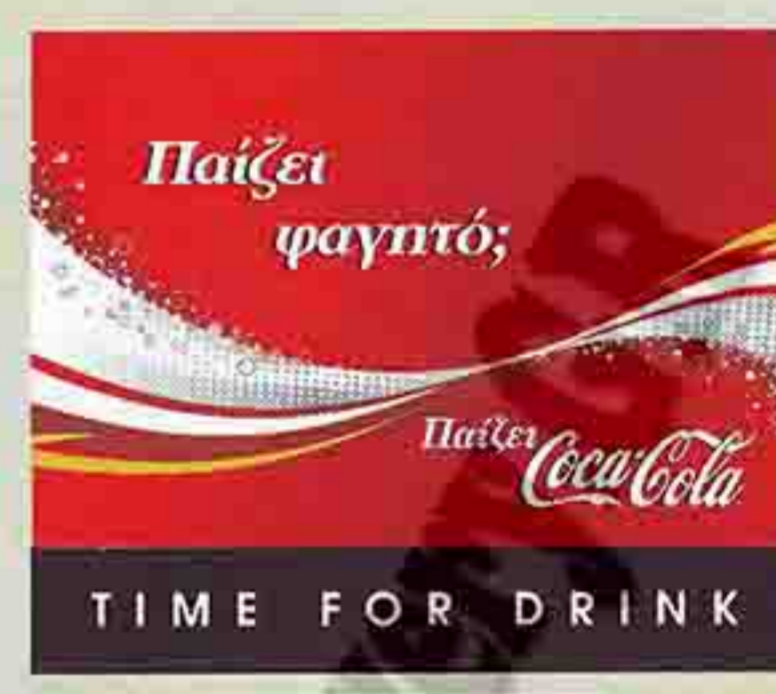
TIME FOR DRINK