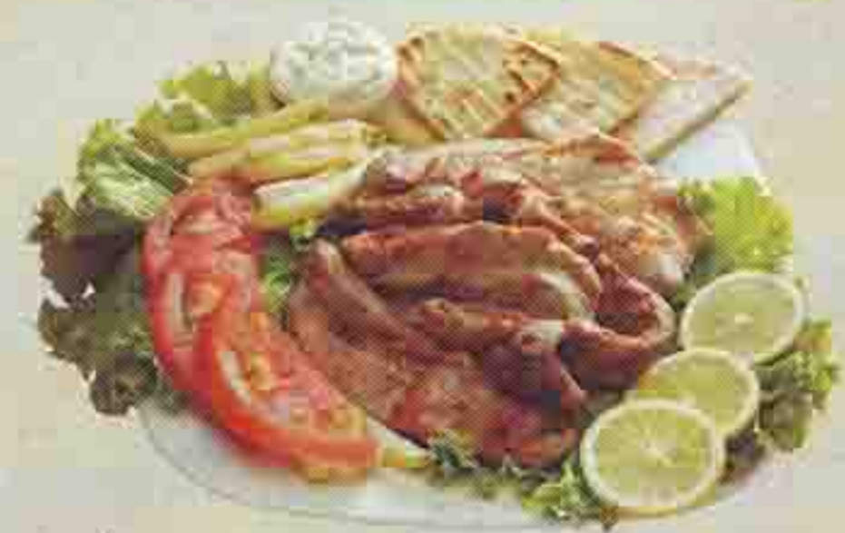
ΜΠΡΙΖΟΛΑΚΙΑ ΧΟΙΡΙΝΑ ΣΧΑΡΑΣ ΜΑΡΙΝΑΡΙΣΜΕΝΑ